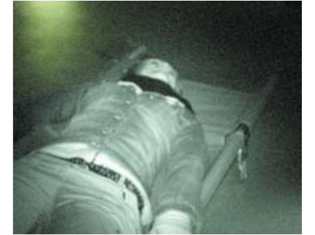
Bahren für die Verletzten und Toten stehen schon bereit