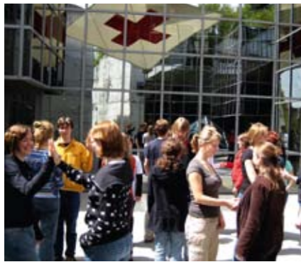
Disarmament Education Workshop

Das Planspiel war nur einer der Höhepunkte der Jugendaktionsreise. Das Aktionsprogramm der „BANgies“ hatte viele weitere interessante Workshops und Events im Angebot, die oftmals durch Kooperationen mit anderen NGOs zustande kamen.