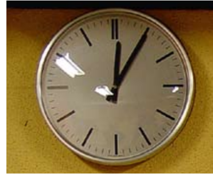
5 nach 12: Atomkriegsalarm! Rette sich, wer kann...

DIE SCHWEIZ BESITZT ZAHLEICHE Atomschutzbunker, die inzwischen teilweise deklassiert sind und als billige Unterkünfte vermietet werden. Während sie im April/Mai 2008 bei der UNO in Genf die Verhandlungen zum Atomwaffensperrvertrag beobachteten, organisierten Jugendliche und Studierende des Jugendnetzwerks BANg die Unterkunft in einem Atomschutzbunker. Dort inszenierten sie, wie der Ernstfall aussehen könnte: