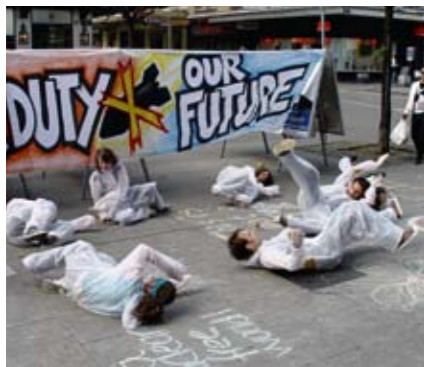
Staaten im Fall