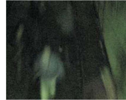
Flucht in den Bunker