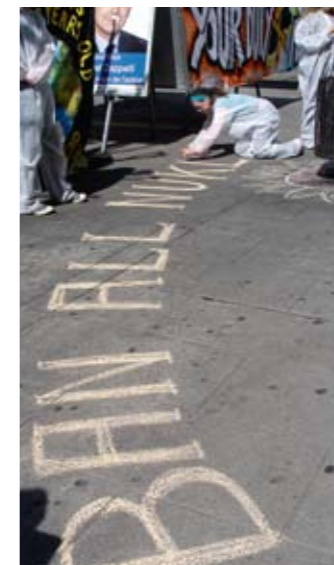
Ban All Nukes!