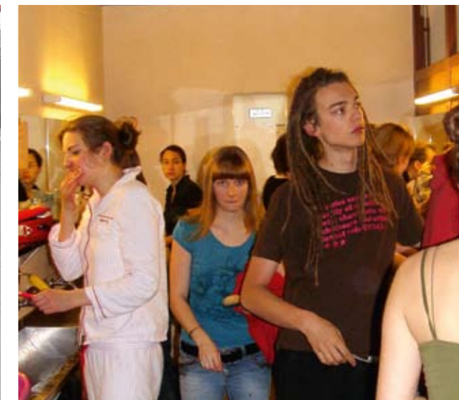
Morgentoilette im Bunker

Rund 80 junge Menschen zogen im Frühjahr 2008 für eine Woche in einen Atomwaffenbunker in Genf, um an einer Aktionswoche zur NPT PrepCom teilzunehmen. Ihre Motivationen waren unterschiedlicher Natur.