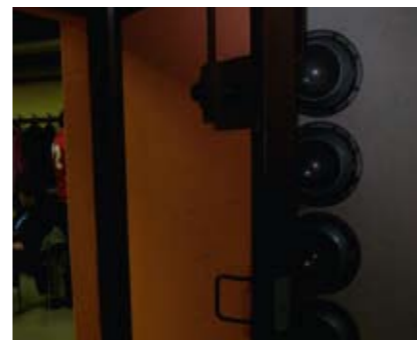
Die Tür geht zu – für wie lange?